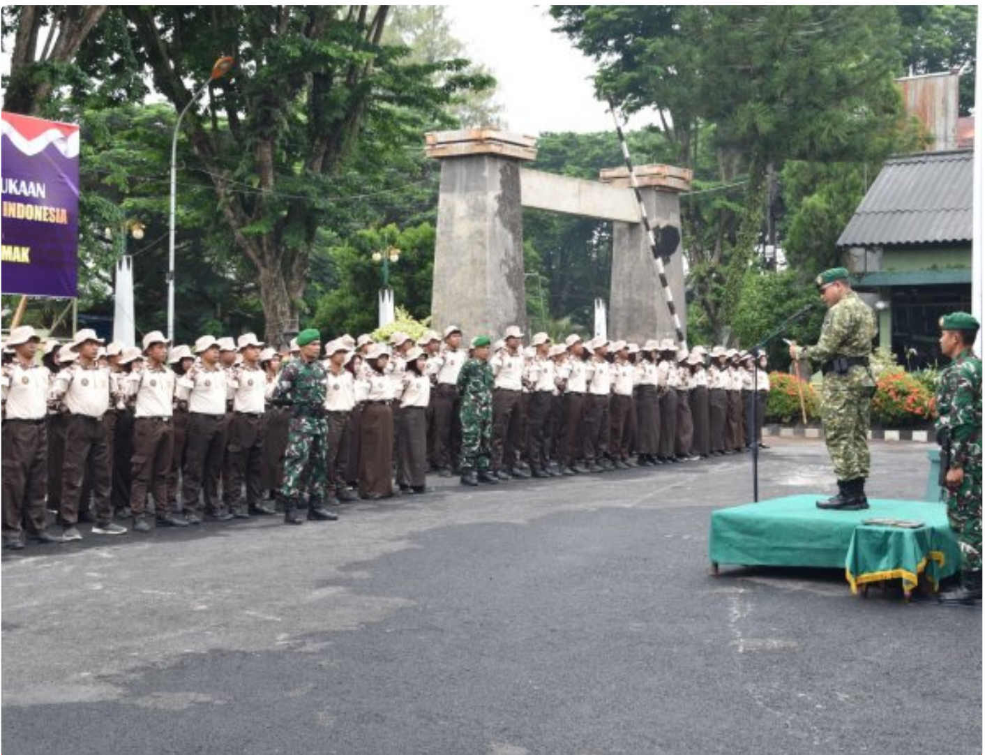
Dandim Demak Resmi Buka Gelaran Korps Kadet Republik Indonesia (KKRI) Di Wilayah Demak

DEMAK – Kodim 0716/Demak secara resmi membuka kegiatan Korps Kadet Republik Indonesia (KKRI) Gelombang IV Tahun 2026 melalui upacara yang khidmat digelar di Lapangan upacara Makodim 0716/Demak Jl. Kiyai singkil No.1 Demak. Jumat (13/2/2026)