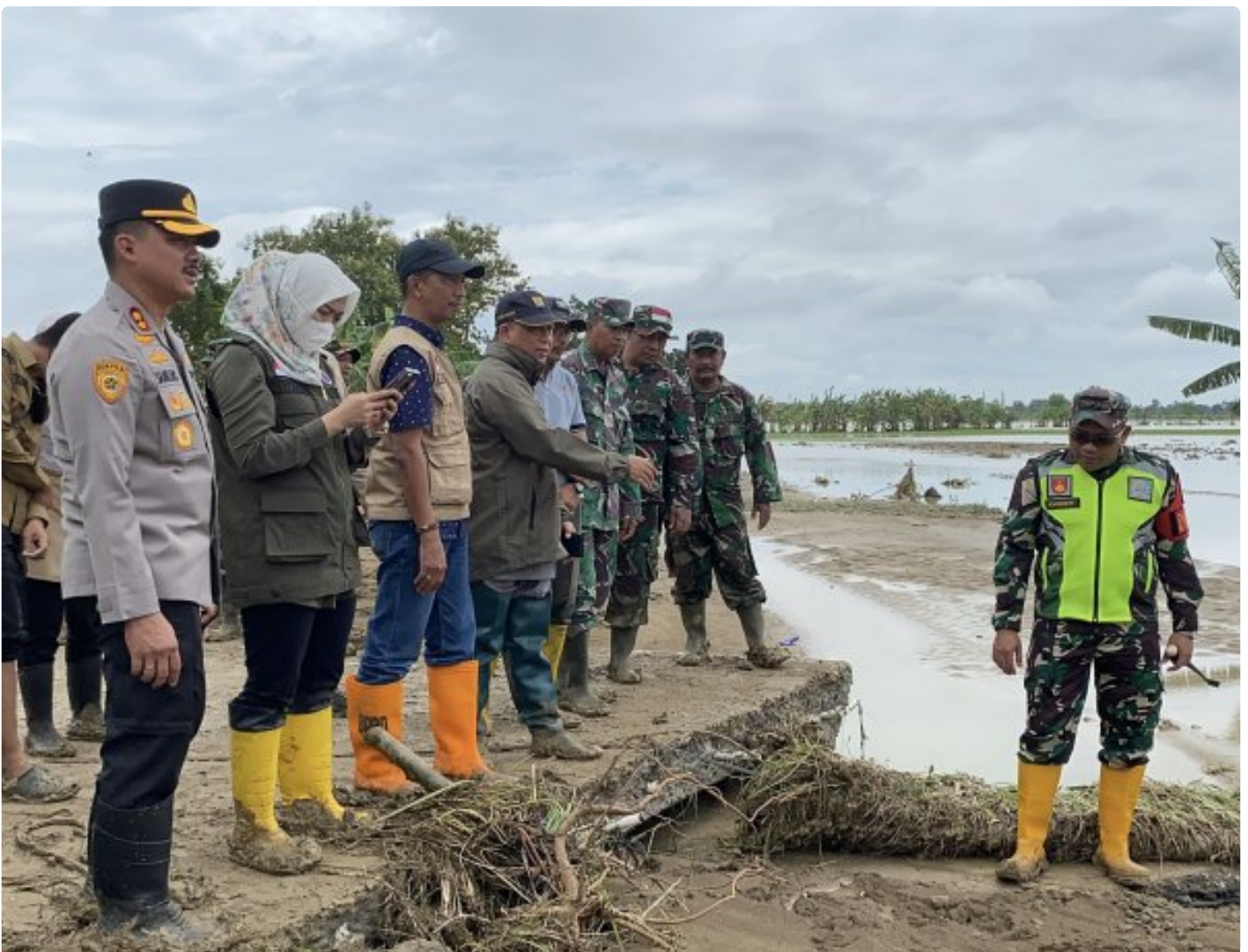
Dandim 0716/Demak Bersama Forkopimda Meninjau Tanggul Sungai Tuntang Demak Yang Jebol

Demak - Tanggul Sungai Tuntang Demak yang jebol di Dukuh Wareng, Desa Kebonagung, Kecamatan Kebonagung mulai ditangani secara darurat dengan melibatkan TNI, Polri, BPBD, hingga masyarakat. Penanganan tanggul Sungai Tuntang Demak ini difokuskan pada penutupan titik jebol serta pemulihan akses